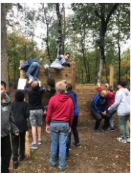
Schoolkamp leerjaar 1