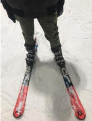
Leer jaar 2 een dagje naar Snowworld