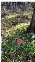
Twee vliegenzwammen op het terrein van De Apollo

In de week voor de herfstvakantie stuur ik u deze Ouder-Apollonia met informatie over De Apollo. Afgelopen periode had ik u al benaderd over het rooster. Deze week is de externe roosteraar weer twee volle dagen bezig geweest om de laatste verbeteringen aan te brengen. Door het aanbod en de mogelijkheid om meerdere vakken te kiezen door de leerlingen in leerjaar 3 en 4, is het helaas ook in het nieuwe rooster zo, dat een aantal leerlingen in leerjaar 3 en 4 meerdere tussenuren kunnen hebben. De 9 e lessen van 15.45-16.30 uur worden ook ingezet, zoals in onze schoolgids vermeld staat. De 9 e lessen worden alleen gebruikt voor leerjaar 3 en leerjaar 4. Na de herfstvakantie start op maandag 28 oktober het nieuwe rooster. Begrijpelijk hebben de roosterperikelen onrust veroorzaakt bij ouders, leerlingen en ons team, we gaan ervan uit dat de grootste problemen nu opgelost zijn. Mocht u na de herfstvakantie nog vragen hebben over het rooster, dan kunt u die natuurlijk aan ons stellen.