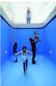
Keuzevak tekenen leerjaar 3 en 4 naar Museum Voorlinden op 16