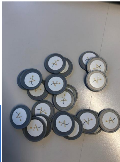
De PBS- muntjes